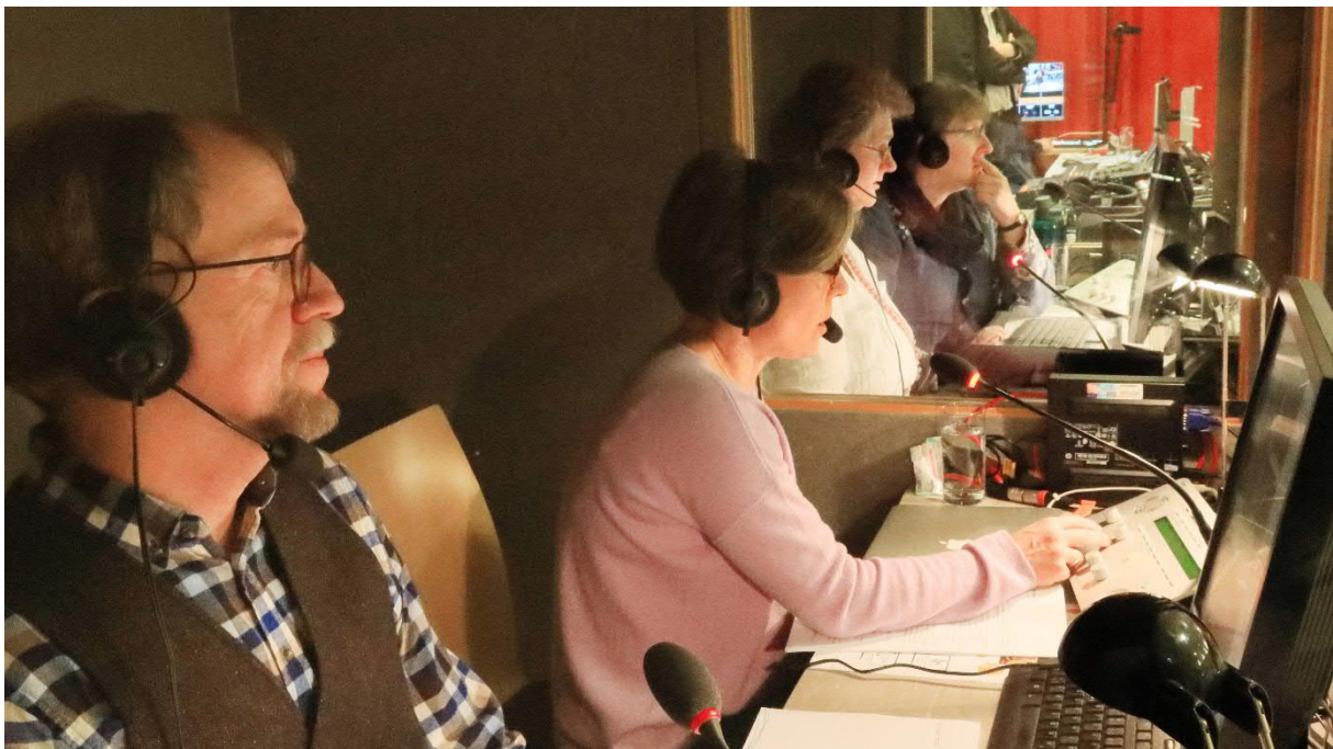
De tolken

Bovendien heeft de theologische commissie alleen schriftelijk een impulsnota ingediend over het inzamelen van collectes . Dit gaat terug op een opdracht van de Synode 2018 (B+V 5/2018). In het initiatief werd toen kritiek geuit op het feit dat in de gemeenten van de Broedergemeente (in Duitsland) traditioneel alleen bij de uitgang wordt gecollecteerd en niet – zoals in veel andere kerken – tijdens de dienst. Sommige giften die nodig en wellicht ook mogelijk zouden zijn geweest, ontvangt men niet op deze manier. Het stuk is bedoeld als uitnodiging voor een discussie in de gemeenten. Het geeft daarvoor een gedegen bijbels-theologisch kader, maar ook concrete handreikingen voor een dergelijke discussie in bijvoorbeeld gespreksgroepen of huiskringen.