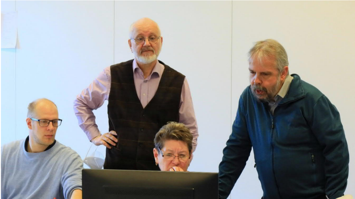
Wachten op een verkiezingsuitslag