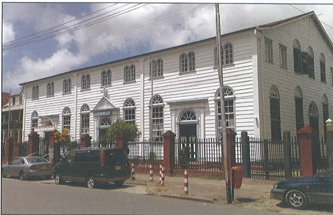
Grote Stadskerk der EBGs sinds 31 mei 1778

In de tweede plaats is mijn wens, dat het hele zendingswerk in het binnenland, moet worden gereactiveerd, want van zending is er niets meer te bespeuren. Daarom is mijn hartewens dat opkomende collega's, ernst gaan maken met huisbezoek, want dat is de ziel van de Broedergemeente. De predikantenopleiding moet structureel worden aangepast, zodat op het Theologisch Seminarie de nadruk gelegd wordt op de vorming van mensen die hart hebben voor de zaak. Dat moet het pad zijn van de Broedergemeente waarop we kunnen voortbouwen aan onze toekomst.